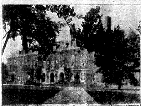
(館書圖學大奈利依) LIBRARY, UNIVERSITY OF ILLINOIS